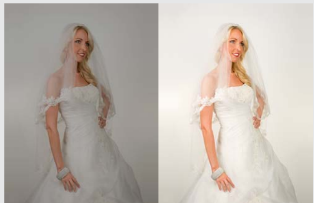
Optimal belichtet? Mit TTL-Blitzsteuerung!